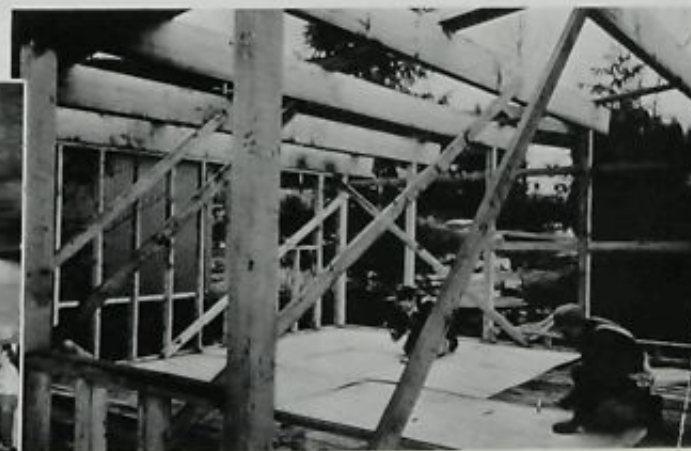
◊ Au Canada, bois d'œuvre ou contre-plaqués sont des matériaux de construction fondamentaux.