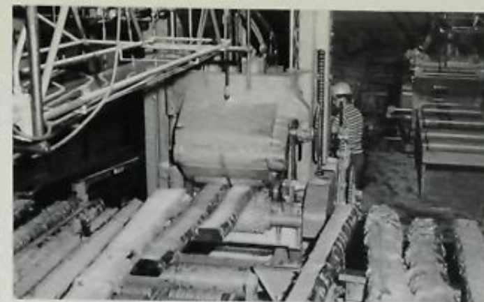
◊ Débiteuse à lames multiples employée dans une scierie automatisée et à fort rendement.