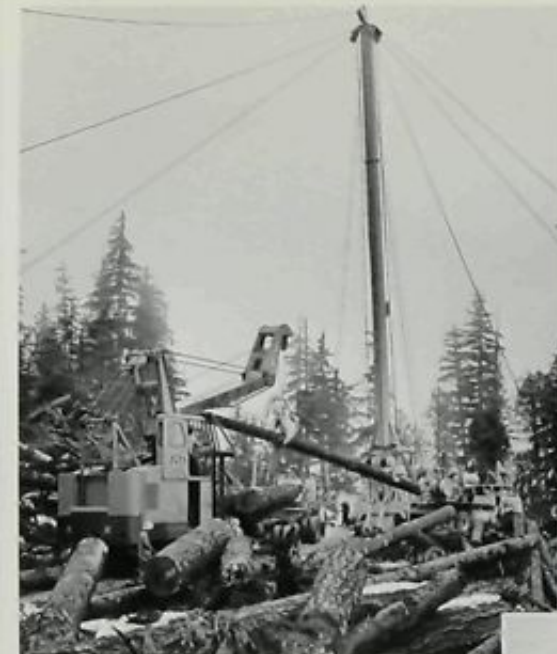
◊ Une flèche à talon pivotant en tous sens manutentionne les billes apportées à l'aide d'un mât de métal portatif.